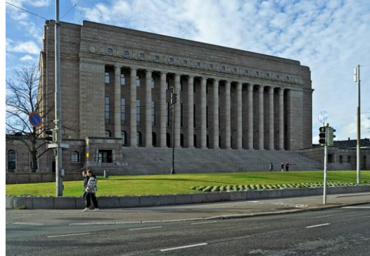
Riksdagshuset

Riksdagshuset ritades av arkitekt Johan Sigfrid Sirén, efter en tävling där 3 arkitekter deltog. Byggstarten skedde år 1926 och huset öppnades år 1931. Riksdagshuset är en massiv byggnad i granit i klassisk stil uppe på Arkadiabacken. Då huset byggdes här i Främre Tölö, var omgivningen ännu ganska lantlig. Tjocka granitpelare pryder fasaden, det känner alla till. Men hur många är pelarna? En sak att fundera på! Vi kan vara glada och stolta över att våra förfäder byggt ett så fint riksdagshus åt oss. Huset är tillbyggt flera gånger, och har också olika utrymmen under marken.